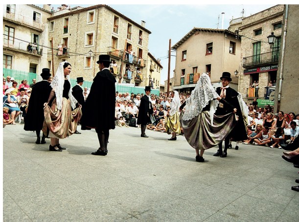
Any 2003.

Hi va haver una segona reforma de vestuari, seguint encara el patró del vestuari típic tradicional. Aquest era el vestuari que encara es portava l'any 2003, el primer any que el nostre equip va pujar a Castellterçol a enregistrar la Dansa i el Ball del Ciri.