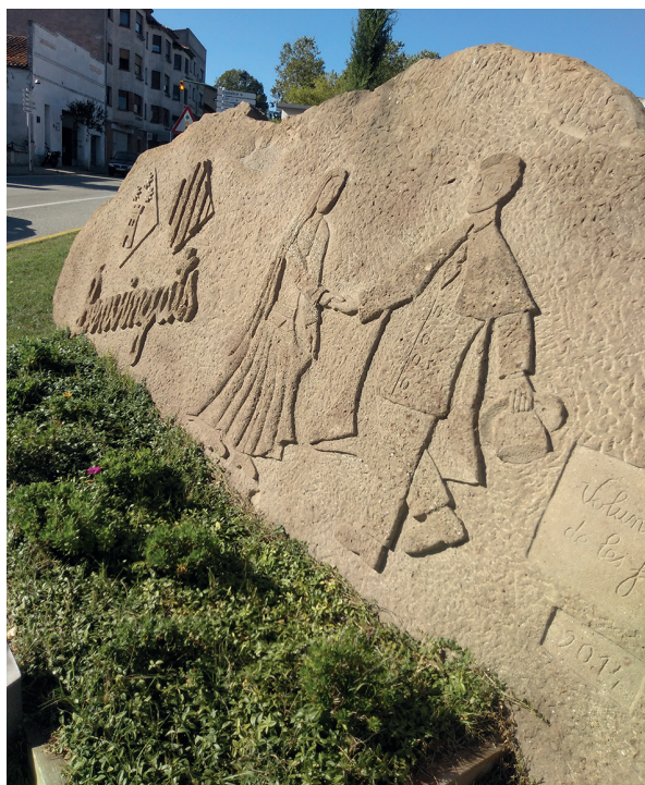
Plafó de benvinguda a l'entrada de Castellterçol.

Per entendre la presència en una mateixa població de dues danses o balls populars de signe divers, com és el cas de Castellterçol, ens cal fer una aproximació al seu medi geogràfic, sociopolític i religiós, és a dir, al seu context. Només així podrem apropar-nos a la complexitat que hi ha implícita en unes manifestacions festives com són la Dansa i el Ball del Ciri, complexitat que d'entrada no es fa visible quan són executades durant la festa major a la plaça Vella plena de vilatans i forasters amatents al ritual festiu que any rere any s'acompleix davant dels seus ulls.