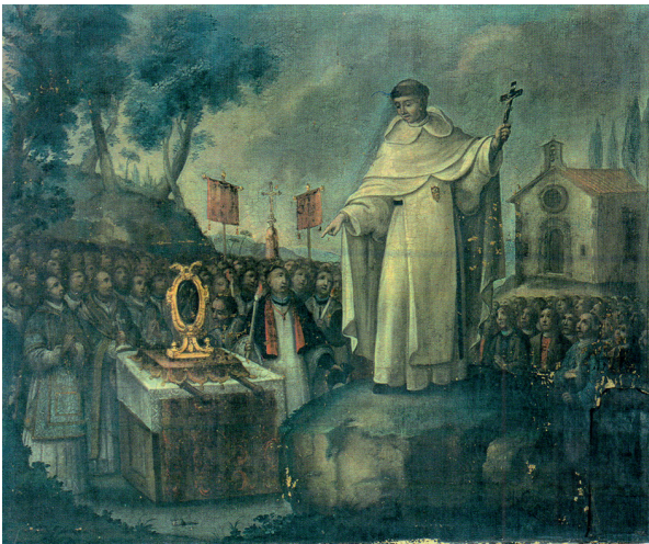
Sant Julià d'Uixols, pregària amb les relíquies dels Sants Màrtirs. Pintura de Marià Colomer a la parròquia de Castellterçol.

Entre tots els balls i danses de Catalunya, crida l'atenció el reconeixement cultural que s'atribueix als de Castellterçol: la Dansa i el Ball del Ciri. ¿Què tenen aquests balls que no tinguin els altres? ¿Què ha fet que uns balls populars locals assolissin un cert estatus de representativitat? Des de finals del segle XIX fins als nostres dies, un seguit de circumstàncies han convergit per a que aquestes manifestacions col·lectives tinguessin un plus cultural identificatiu.