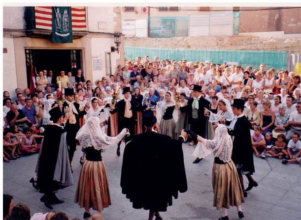
Any 2003.