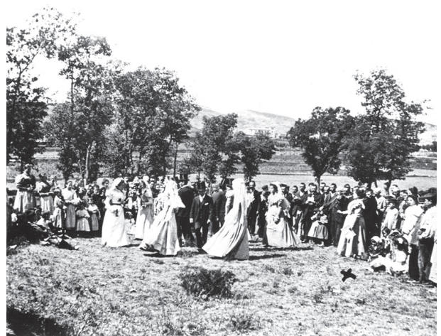
Any 1897.