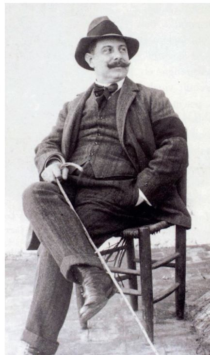
El compositor guixolenc Juli Garreta (1875-1925).

En el primer text apel·la a la catalanitat de Garreta i a la seva singularitat com autodidacta, que va poder explotar el seu talent com artista gràcies a tres factors: la seva pròpia naturalesa espiritual, les qualitats innates per a la música i el progressiu enriquiment de l'ambient cultural guixolenc. Això, sumat a una dedicació constant i exigent que es va intensificar en reemprendre la composició de manera fervorosa durant la seva darrera dècada de vida, va confegir un corpus que tenia